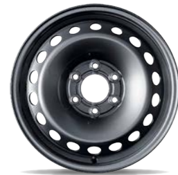
Stahlrad 6,5 J x 16