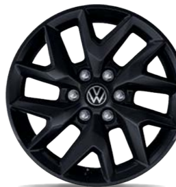
Leichtmetallrad „Le Mans“ 6,5 J x 17, in Schwarz