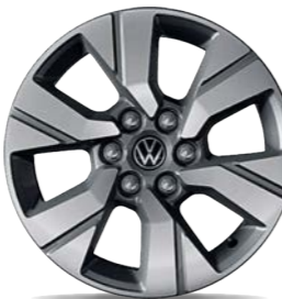
Leichtmetallrad „Monte Carlo“ 6,5 J x 17, in Grau