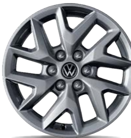
Leichtmetallrad „Le Mans“ 6,5 J x 17, in Silber