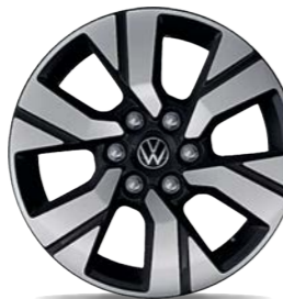
Leichtmetallrad „Monte Carlo“ 6,5 J x 17, in Schwarz