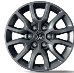
Leichtmetallrad „Montreal“ 6,5 J x 16, in Grau