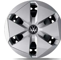
Stahlrad mit Radvollblende 6,5 J x 16, in Silber